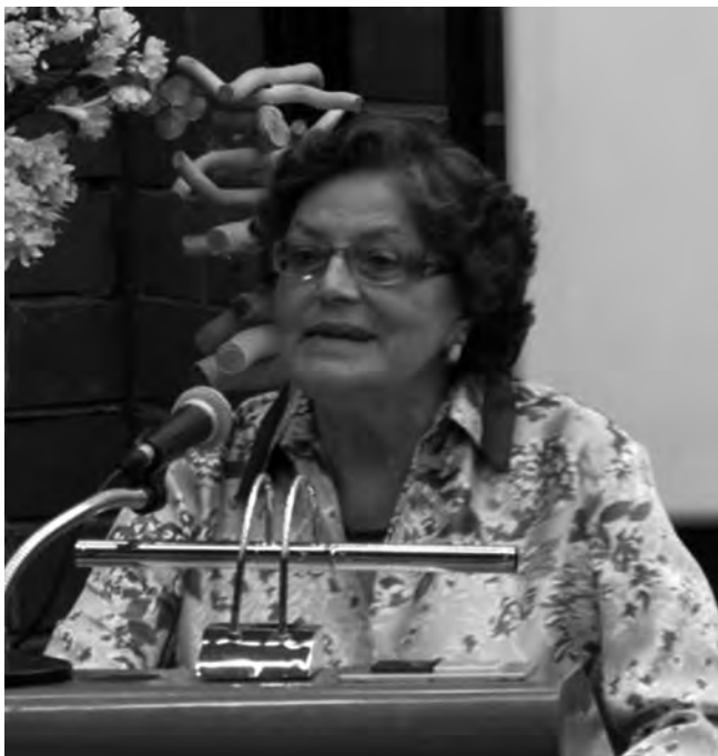
Fig. 7. La Dra. Durfort durant l'acte d'homenatge que la UB va oferir-li el 3 d'octubre del 2013 en agraïment a tota una vida dedicada a la Universitat.